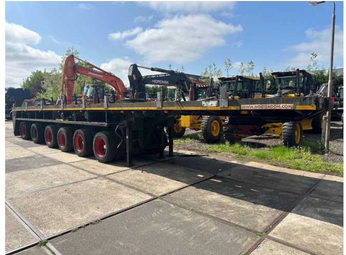
Nootboom OBL 78 FORCED STEERING